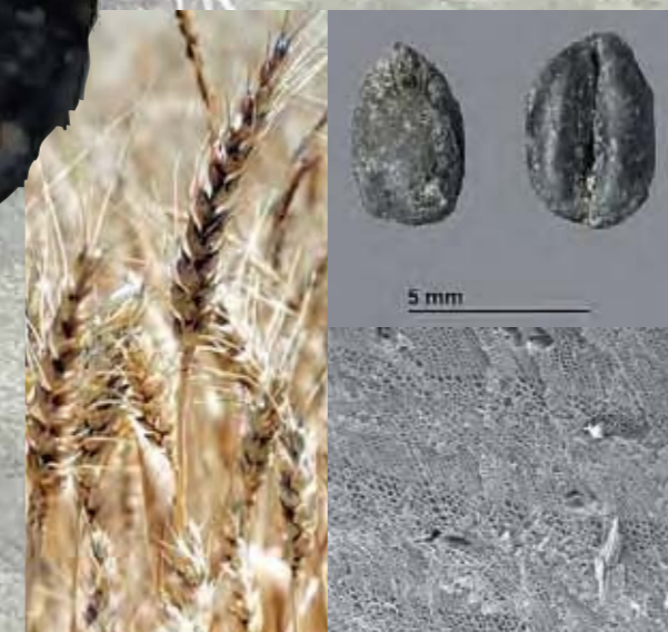
>Fragmentos de trigo carbonizado | EIA

Las plantas que se domesticaron primero son las anuales, que se convierten rápidamente en recursos de primera necesidad y forman parte de la alimentación. En cada área tiene éxito una serie de cultivos que gracias a la dispersión humana se trasladan de una zona geográfica a otra en diferentes fases de nuestra historia. Las actividades agrícolas que se conocen son la siembra, cosecha, trilla, rastrillado, aventado, cribado, torrefacción, majado, secado, almacenaje, clasificación y molienda. En los registros carpológicos podemos identificar algunas de ellas.