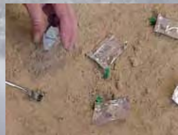
>Recolección manual de carbones para datación | EIA

Los restos orgánicos, como la madera o los frutos, no se conservan con facilidad. El FUEGO ejerce un papel prioritario