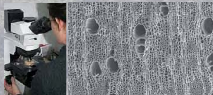
>Microscopio metalográfico y fragmento de carbón de higuera al microscopio | EIA

La identificación taxonómica de los restos de madera carbonizada se realiza a través de la estructura celular de la madera. Cada especie leñosa tiene una ESTRUCTURA CELULAR concreta que se conserva incluso después de la carbonización. Mediante microscopio metalográfico se comparan los restos con frutos y semillas actuales para identificar las especies.