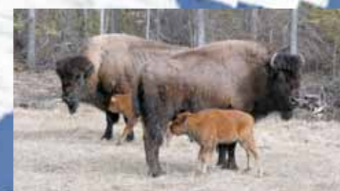
L'ANSE AUX MEADOWS